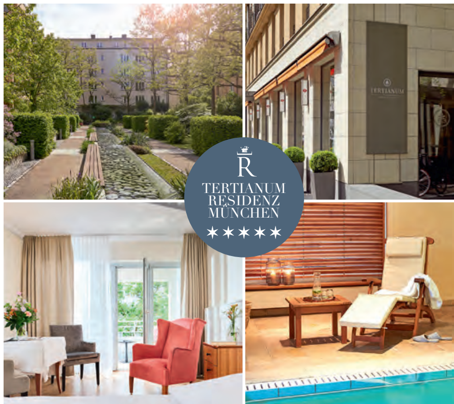
Zimmerverfügbarkeit und Preise werden ausschließlich auf Anfrage mitgeteilt.

Angebote: 5-Sterne-Service und jeden Tag ein besonderes Maß an Aufmerksamkeit. Ob Erholung im Wellnessbereich inkl. Schwimmbad und Kneipp-Becken, bei einem der Bewegungskurse, im gemütlichen Kaminzimmer, in der eigenen Bibliothek oder bei einer exklusiven Kulturveranstaltung im Roten Salon. Genießen Sie die schönen Dingen des Lebens. Mit angrenzender Brasserie Colette konzipiert von 2-Sterne Koch Tim Raue.